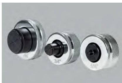
HY-EX Spare Heads / Ersatzköpfe