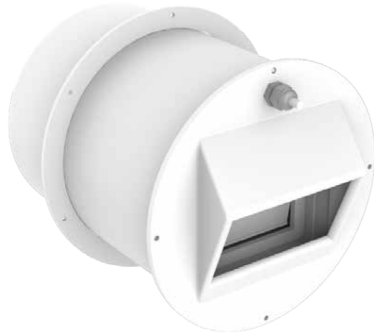
MOD. MAXIELEBAR BT